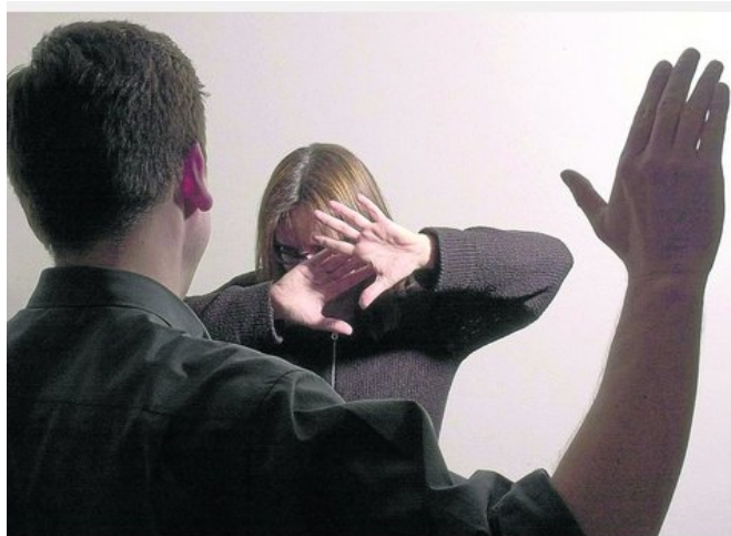
Wenn die Hand ausrutscht: Diese Szene ist nachgestellt, aber Gewalt gegenüber Partnern und Kindern ist auch in der Region ein Problem. Der Verein Wege ohne Gewalt hilft mit Beratung und Kursen.

GÖTTINGEN. Kennen Sie das Gefühl, dass Ihnen manchmal die Hand ausrutscht? Wissen Sie sich manchmal nicht mehr anders zu helfen, als laut zu werden, zu schubsen oder zuzuschlagen? Und denken Sie, Ihre Partnerin oder Ihr Partner müsste sich doch bloß ändern, dann wäre alles gut?